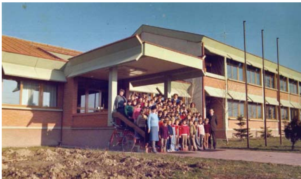
Nova škola / Нова школа