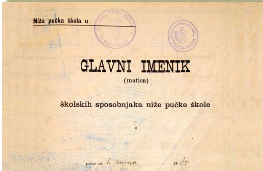
Naslovnica glavnog imenika iz 1894. / Насловна страница главног именика из 1894.