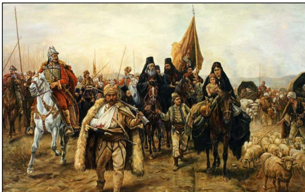
Paja Jovanović: Velika seoba Srba / Паја Јовановић: Велика сеоба Срба

započela ofanzivu protiv Turaka u Ugarskoj, Dalmaciji, Albaniji i Grčkoj. Austrijanci napreduju niz Dunav i 1686. godine oslobađaju Budim, a 1687. godine Turci su poraženi nedaleko od Mohača, nakon čega Austrijanci oslobađaju Baranju, Bačku i Srijem. Austrijske trupe, predvođene brojnim Srbima iz oslobođenih krajeva Ugarske, zauzimaju Beograd 1688. god., nakon čega kreću prema jugu i oslobađaju Skoplje, Prizren, Peć i druga mjesta. Pad Beograda i uspjesi Austrijanaca doprinijeli su jačanju ustaničkog pokreta u Srbiji.