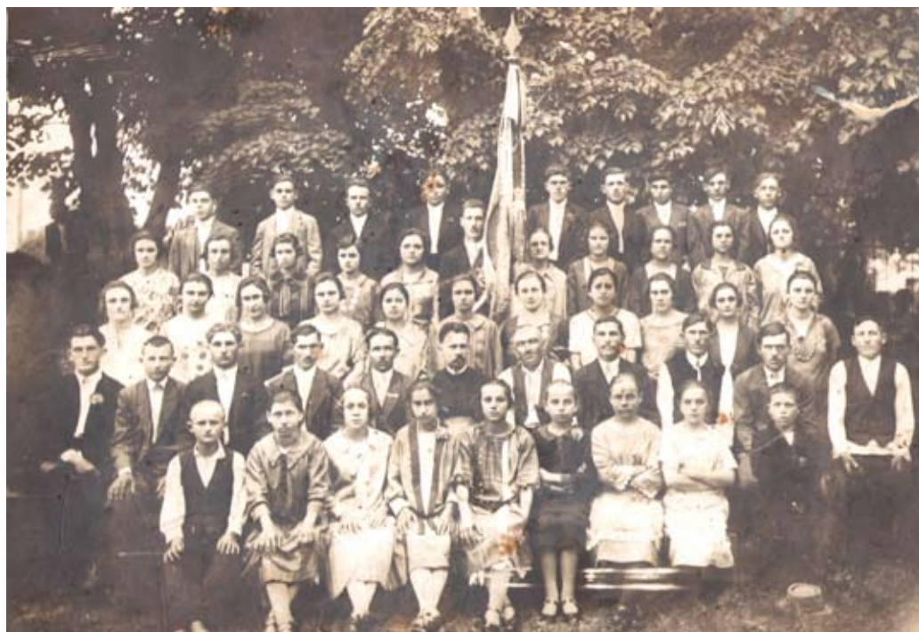
Pjevačko društvo „Srbadija“, 1927. godine; prethodnik današnjeg KUD-a „Bekrija“. / Певачко друштво „Србадија“, 1927. године; претеча данашњег КУД-а „Бекрија“.

Многи ученици Основне школе Негослави такође су активни чланови дечје и омладинске фолклорне групе КУД-а „Бекрија“, а до сада је више од 200 деце различитог узраста својим чланством и активним радом учествовало у играчко-педагошком раду КУД-а.