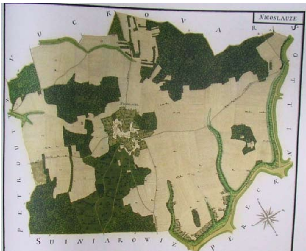
Atlas Vukovarsko vlastelinstvo 1733 . god. / Атлас Вуковарско властелинство 1733. год.