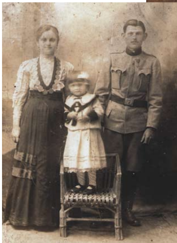
Mlada negoslavačka obitelj. / Млада негославачка породица.