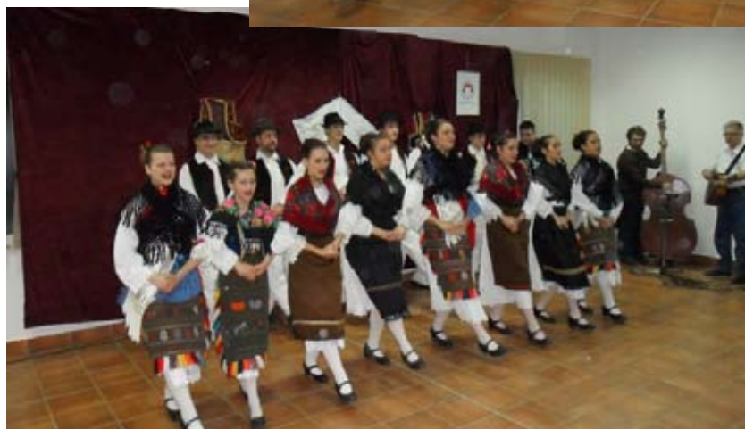
Današnja dečja i omladinska folklorna skupina. / Данашња дечја и омладинска фолклорна група.