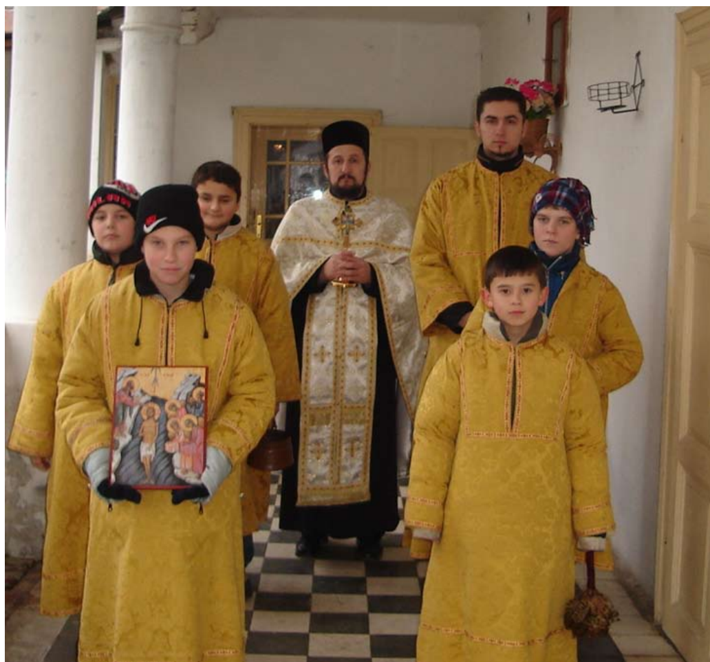
Vogojavlјenske vodice danas / Богојављенске водике данас

koji je bio veoma zahtevan i tako došao u sukob sa crkvenom opštinom u vezi tzv. pojačke nagrade. On je disciplinarno kažњen, a један од ставака у оптужби је да није долазио на богослужења са ученицима, а то је било обавезно. Из данашње перспективе морамо да се трудимо да разумемо неке захтеве учитеља, јер се тада доста сиромашно живело, другачији је био систем плаћања. Не смемо ни у ком случају да испустимо из вида, да иако је школа комунална, она је и даље суштински повезана са духовним животом села, односно Црквом.