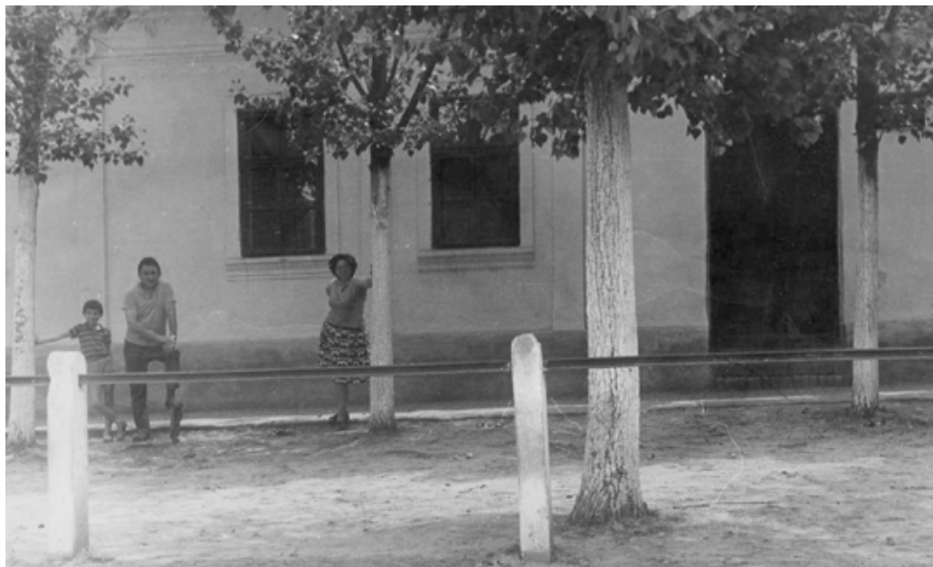
„Velika škola“ / „Велика Школа“

veћаo broj učenika, pojavila se potreba za većom školom. Godine 1894. podignuta je još jedna zgrada koja se zvala „Mala škola“ jer se u njoj održavala nastava za I i II razred.