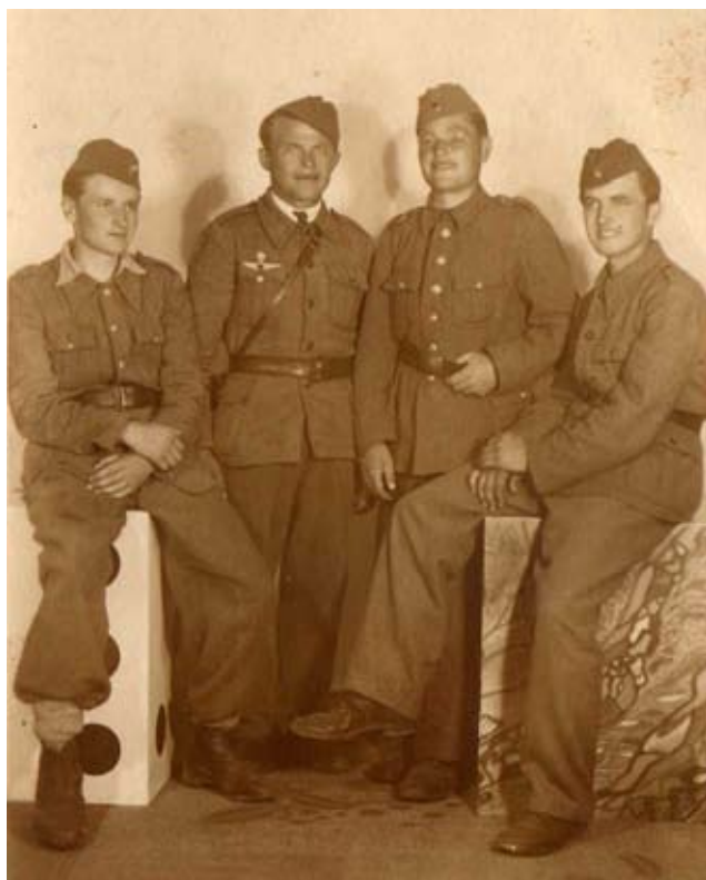
Negoslavčani u partizanima / Негославчани у партизанима

Pokret otpora protiv NDH i Nijemaca u Srijemu su organizirali pripadnici Komunističke partije Jugoslavije (partizanski pokret). Mjesni narodnooslobodilački odbor formiran je u Negoslavcima 25. 2. 1943., a u isto vrijeme formirana je i partijska organizacija u selu.