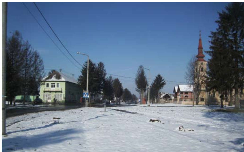
Negoslavci 2011. / Негославци 2011