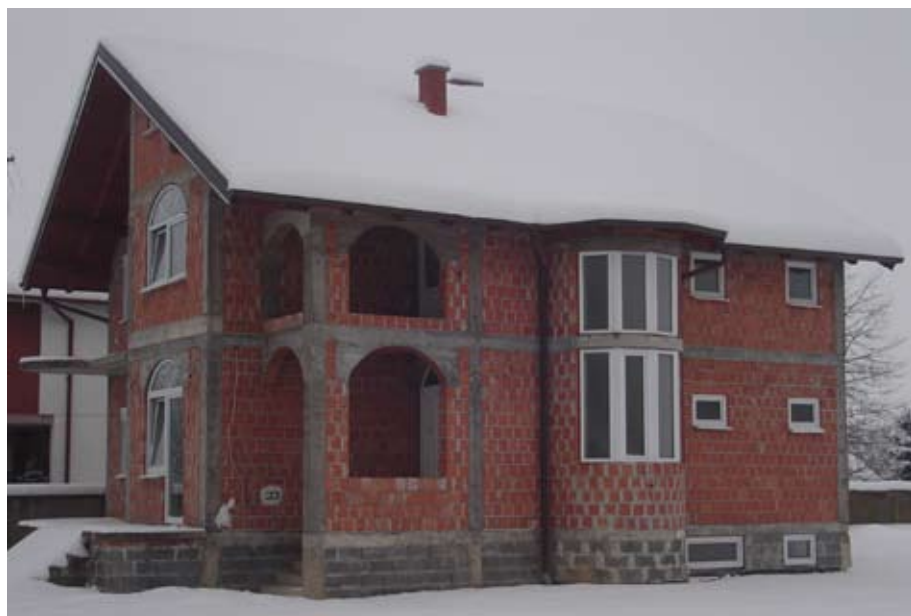
Svećenički dom u izgradnji / Парохijski дом у изградњи