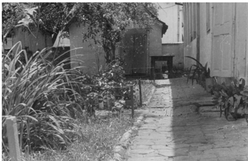
„Velika škola“ - dvorište / „Велика школа“ - двориште