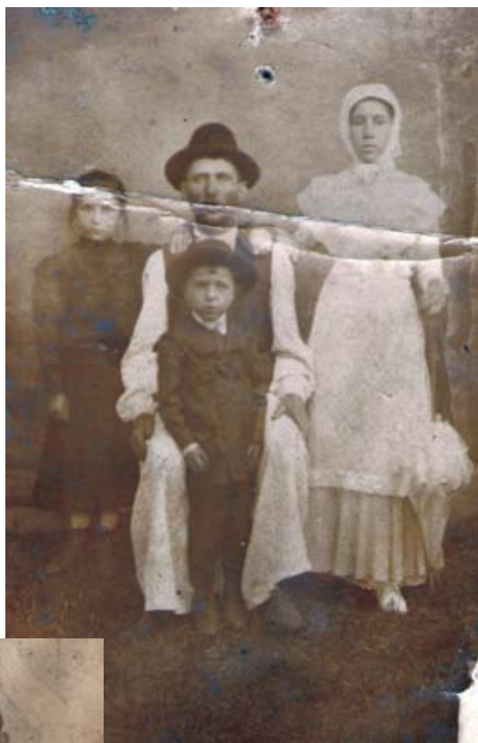
Negoslavačka obitelj. / Негославачка породица.