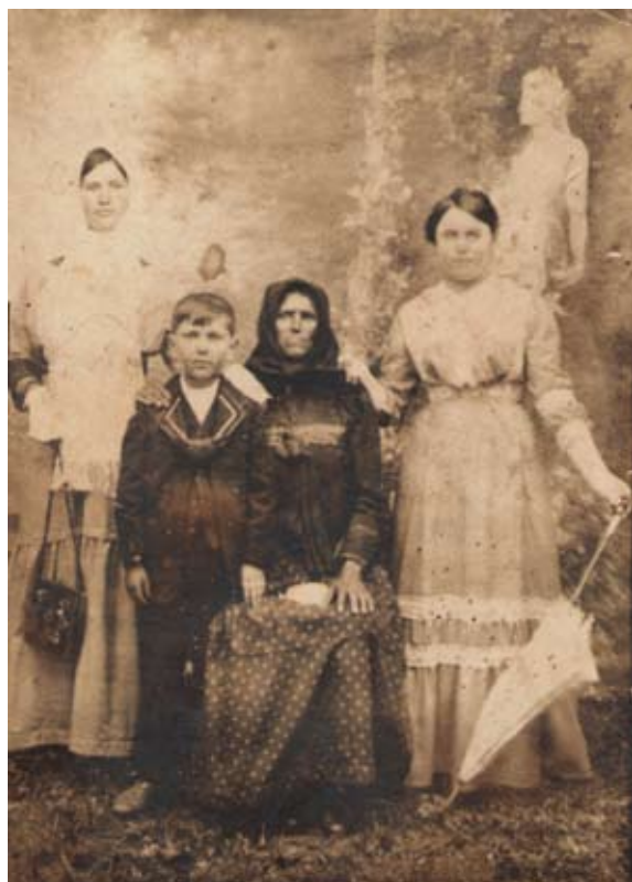
Odijevanje starijih u odnosu na odijevanje mlađih žena. / Одећа старијих у односу на одећу млађих жена.