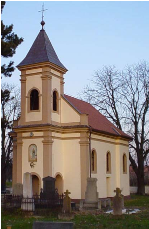
Kapela svetog Ivana Krstitelja / Капела светог Јована Крститеља