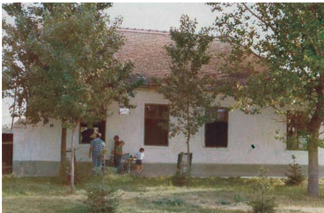
Rušenje „Male škole“ / Рушење „Мале школе“