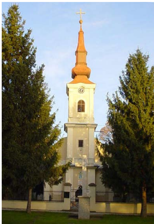
Crkva Usnuća Presvete Bogorodice / Храм Успенија Пресвете Богородице