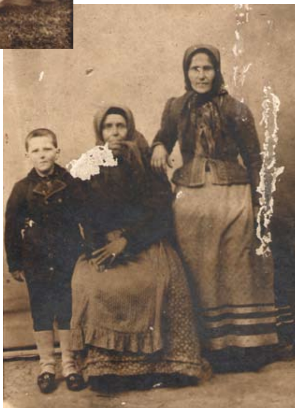
Odijevanje starijih žena. / Одећа старијих жена.