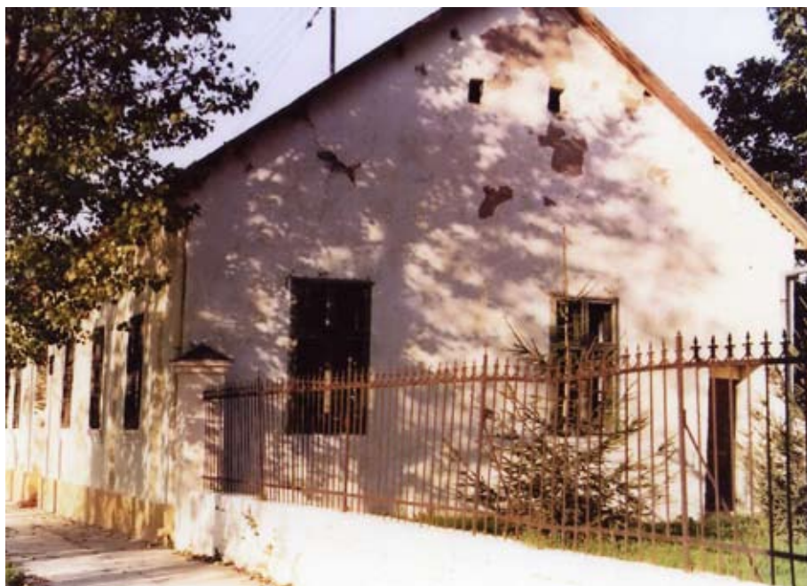
Stara škola na čijem mjestu se gradi parohijski dom / Стара школа на чијем се месту гради парохijski дом