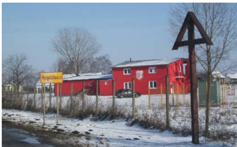
NK Negoslavci / ФК Негославци