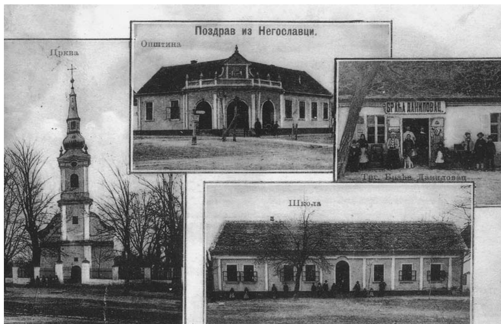
Negoslavci 1909. god. / Негославци 1909. год.

govore da se u selu nalazilo oko 1.200 vojnika, koji su se starali o konjima. Sve kuće u selu bile su zauzete, sve kapije uvijek otvorene. Sokacima su se kretali ljudi i konji kao da je svaki dan vašar. Vojska je otišla iz sela u svibnju 1915. godine. 35